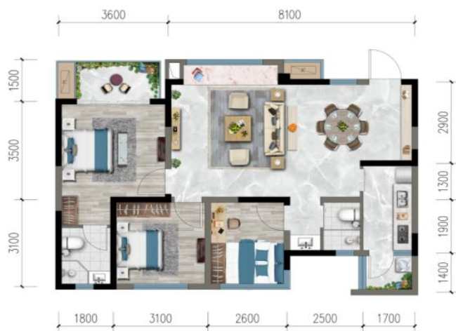
装修效果图示意图