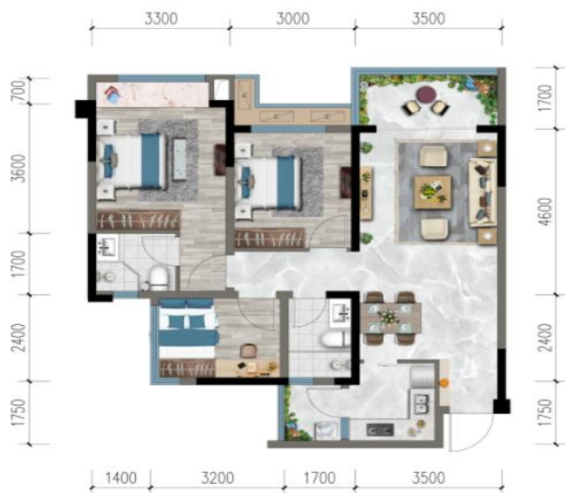
装修效果图示意图