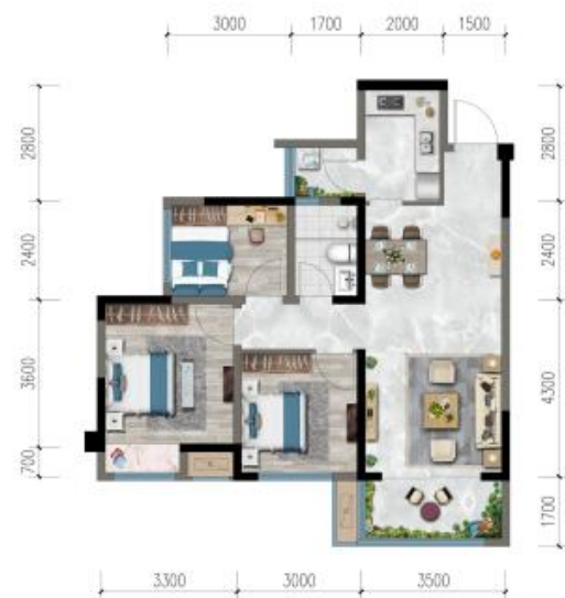
装修效果图示意图